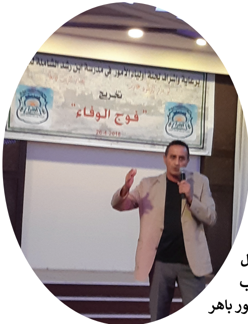
اللجنة تقيم الاحتفال الاول بتخريج طلاب مدرسة ابن رشد صور باهر