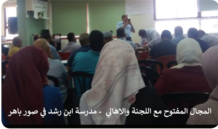
المجال المفتوح مع اللجنة والاهالي - مدرسة ابن رشد في صور باهر