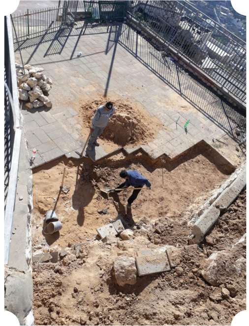
اللجنة تشرف على تنفيذ ترميم ساحة مدرسة سلوان الاعدادية للبنات