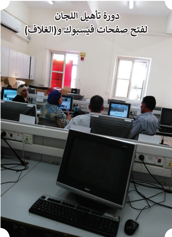
دورة تأهيل اللجان لفتح صفحات فيسبوك و(الغلاف)