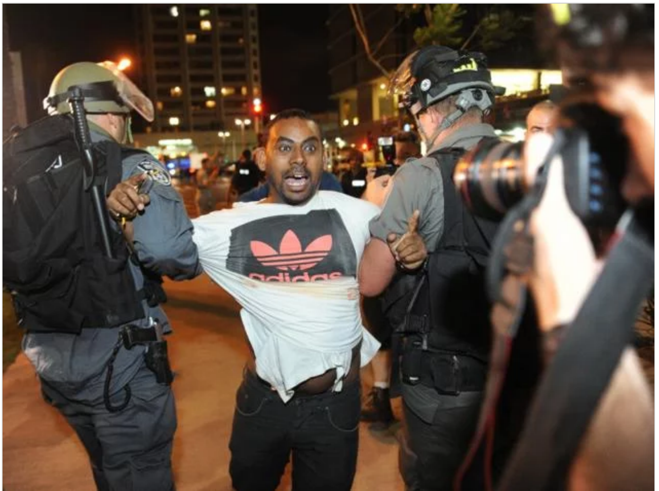
"אם לא תבואו עכשיו, אני הולך למות"

רק באולפני קליפ נולד - 037447571. הקליטו והצטלמו לקליפ מקסים לאירוע kvid.co.il