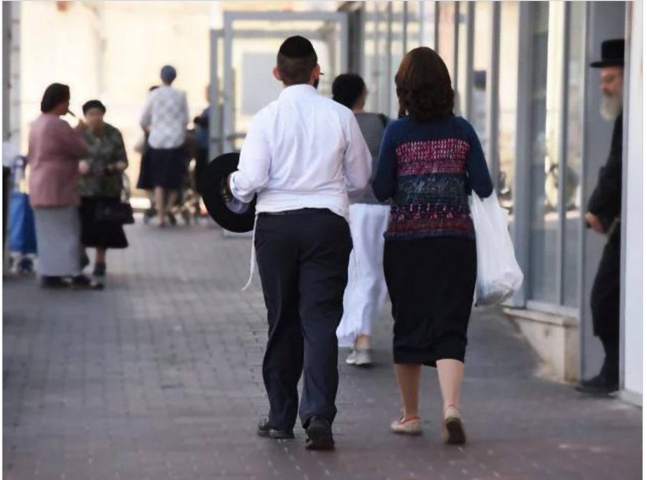
שוטר הציע שלא ישובצו שוטרות לעבודה באזורים שבהם מתגוררת אוכלוסייה חרדית. זוג חרדי בבני ברק

"העלנו סיטואציה של אישה שפונה לגבר. מדובר באירוע שמתקיים בשכונה חרדית, בבני ברק או במאה שערים ובניידת נמצאת שוטרת עם מתגבר. השוטרת צריכה להיכנס לדירה ולדבר עם האבא, דבר מורכב בגלל שמדובר באדם חרדי", סיפר השוטר שהציג את המקרה. "הפתרון שהצענו הוא לפנות באמצעות המתגבר או לבדוק אם יש באזור שוטר שיכול להגיע למקום", אמר.