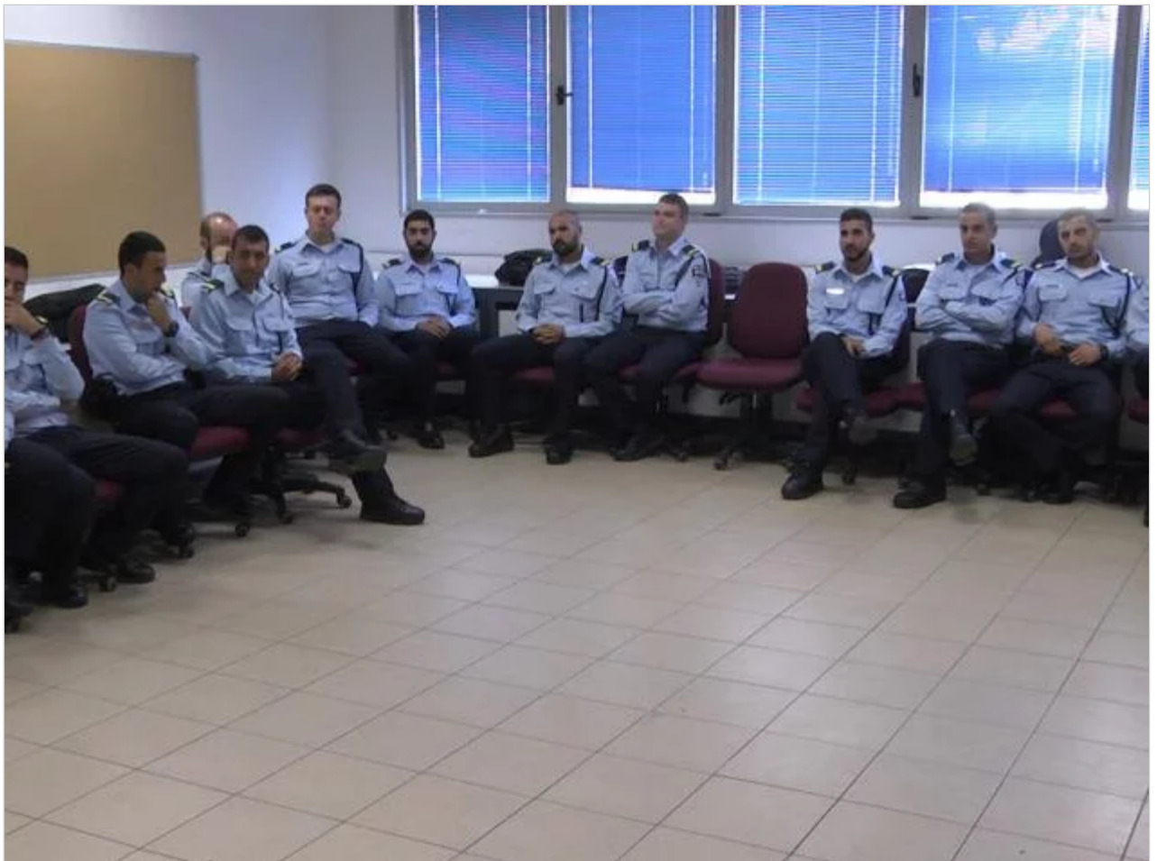
שוטרים בסדנה, בחודש שעבר

הצורך בקורס כזה, שאודותיו נחשפים לראשונה בוואלה! NEWS, ברור. בשנים האחרונות גברה המודעות בציבור ובצמרת המשטרה במורכבות המגע בין אוכפי החוק לבין מיעוטים בחברה הישראלית, ובראשם, יוצאי אתיופיה. שורה של מקרים של אלימות משטרתית הולידו גל מחאה חסר תקדים שהוביל לתהליך של הפקת לקחים ולחיבורו של דוח למיגור הגזענות נגד יוצאי אתיופיה במשרד המשפטים. דוח שמסקנותיו דווקא לא אומצו על ידי המשטרה.