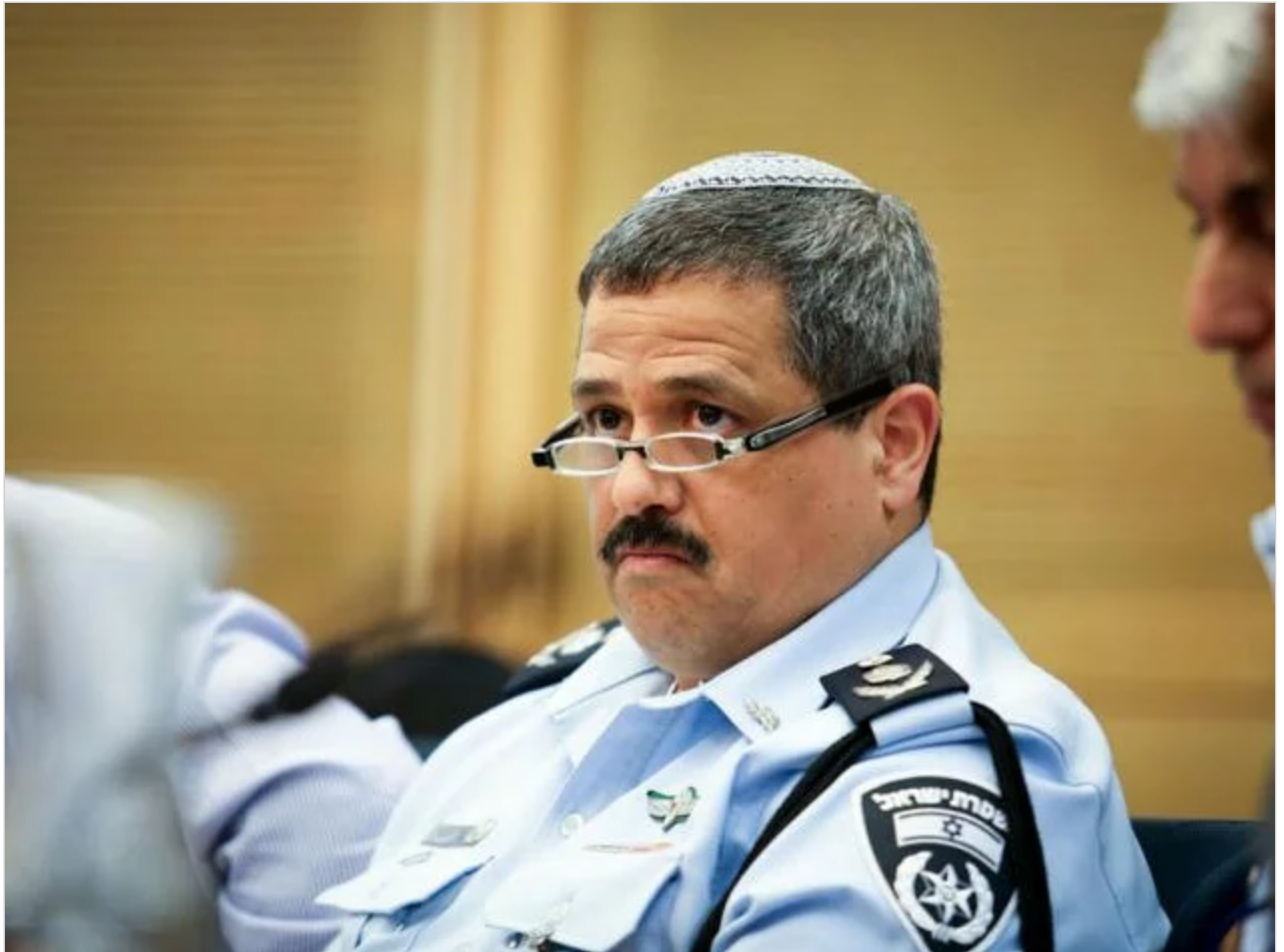
עורר סערה. אלשיך

הבעייתיות שבטרמינולוגיה באה לידי ביטוי לאחרונה גם בלשוננו של המפכ"ל רוני אלשיך. בנאום שנוי במחלוקת שנתן בסוף חודש אוגוסט השתמע כאילו טבעי ששוטרים יחשדו יותר בבני העדה האתיופית. דבריו עוררו סערה ציבורית על רקע הטענות הקשות כלפי התנהלות במשטרה בסוגיה. לאחר הביקורת החריפה שנמתחה על דבריו פרסם אלשיך הבהרה. "לא הייתה לי חלילה כל כוונה לפגוע אלא להציף את הבעיה על מנת לקדם פתרונות מוסכמים", אמר.