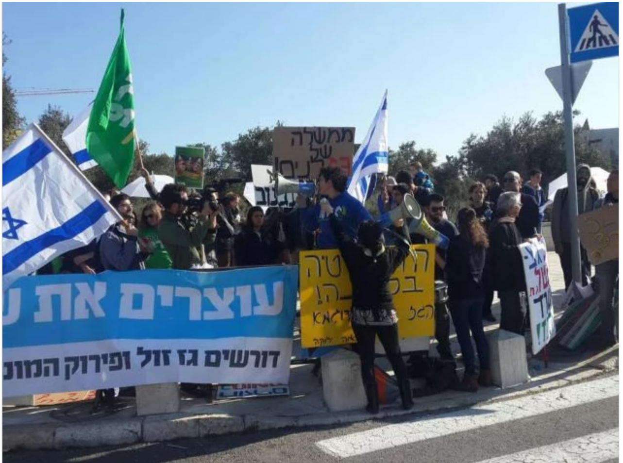
הועלו טענות שהמשטרה נוקטת הליכים משפטיים נגד מארגני ההפגנות שלא הפרו את הסדר. הפגנה נגד מתווה הגז, בפברואר

בשנים האחרונות נמתחה ביקורת על המשטרה בנוגע להתנהלות שוטרים במהלך הפגנות, במיוחד בהפגנות שהתקיימו השנה נגד מתווה הגז. פעילים רבים נעצרו והועלו טענות כי המשטרה נוקטת הליכים משפטיים נגד מארגני ההפגנות שלא הפרו את הסדר. "אפשר לחבור למי שמוביל את ההפגנה ולהבין על מה היא", אמר שוטר אחר. "אנחנו נוכל אולי להגיע לפתרון בלי תקשורת ובלי התערבות של הפיקוד או של הדוברות, ולתת להם לממש את זכותם הדמוקרטית. יש אירועים רבים שאין בהם עבירה פלילית", הוסיף.